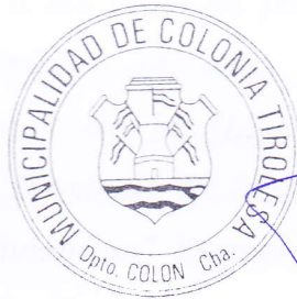
REMIGIO O. LAURET INTENDENTE MUNICIPAL MUNICIPALIDAD DE COLONIA TIROLESA